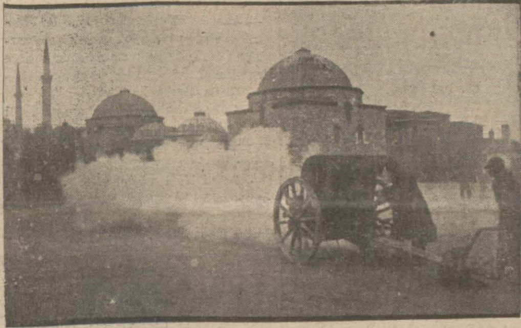
Millî Şefin tekrar Reisisicümhur seçilmesi dün şehrimizde toplanan ilân edilirken Ankara 3 — B. M. Meclisi altıncı intihap devresinin ilk toplantısını bugün yapmıştır. (Devamı 11 inci sayfada)

Parti Grubu bu sabah toplanıyor, hükümet dış politika işleri etrafında Grup azalarına izahat verecek