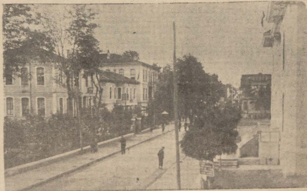
Adapazarından bir görünüş

Belediye kazanın temizliği ile şiddetle alâkadar oluyor kasabada yiyecek ihtikârı gittikçe fazlalaşmaktadır