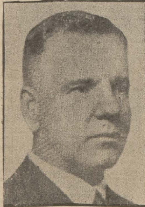
Yeni Nafia Vekili Ali Fuad Cebesoy