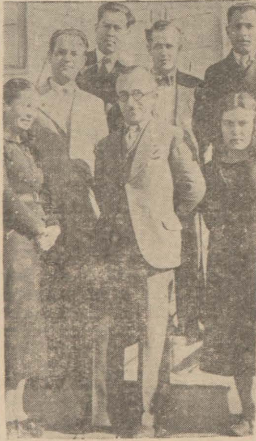
Kuyucak ilk mektebi muallimleri

Evvelce açılmış olanlara ilâveten yeniden daha üç araziye açılmasına yakında başlanacaktır. Belediyemiz bundan sonra su depolarını inşa ettirerek tevziata ve çeşme inşasına geçecektir.