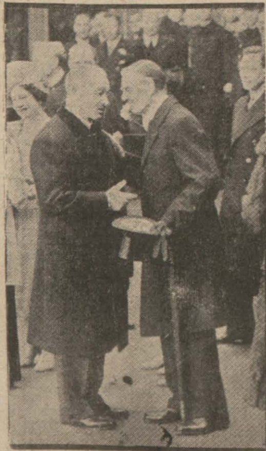
İngiliz başvekili Londraya giden Fransız reisisicümhuru ile bir mülakâde esnasında

Salâhiyyetler mahfellerde söylendiğine göre, Bek'in Londrada yapacağı görüş - meler beynelmîlel hâdiselerin seyrinde kat'i bir merhale teşkil edebilecektir. Bu görüşmeler esnasında İngiliz - Fransız (Devamı 11 inci sayfada)